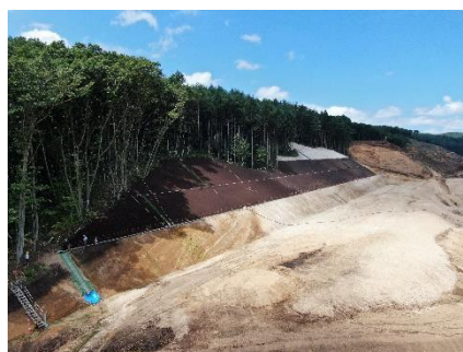
法面の植生基材吹付け状況 (施工中)