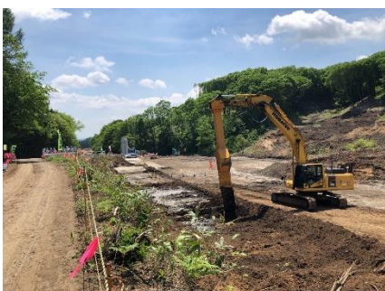
地盤改良状況(施工中)