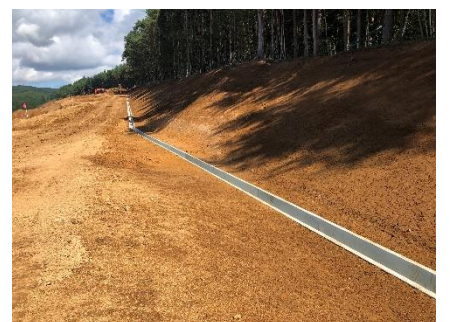
法面の小段排水設置状況 (施工中)