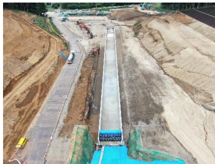
防災調整池工(施工中)