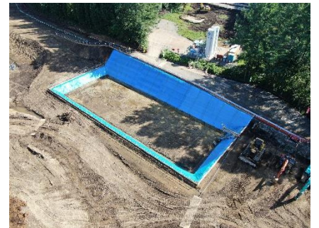
仮沈砂池設置完了